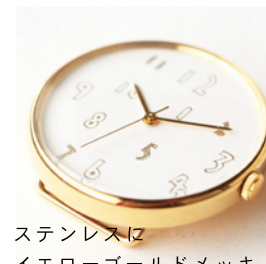
ステンレスに イエローゴールドメッキ 18,500 円