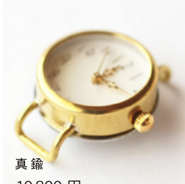
真鍮 10,800 円