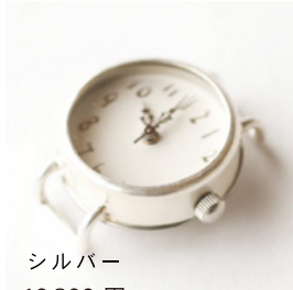
シルバー 10,800 円