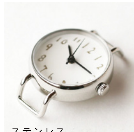
ステンレス 14,500 円