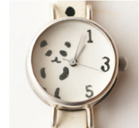
ハンコ文字盤 + 1,000 円