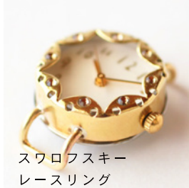
スワロフスキー レースリング シルバー、真鍮各種 13,500 円