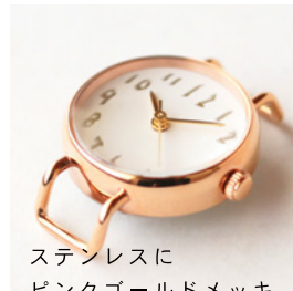
ステンレスに ピンクゴールドメッキ 16,000 円