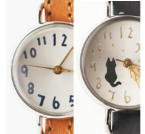
色付き数字 イラスト入りの文字盤 + 500 円