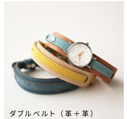
ダブルベルト (革+革)