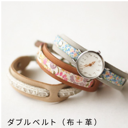
ダブルベルト (布+革)