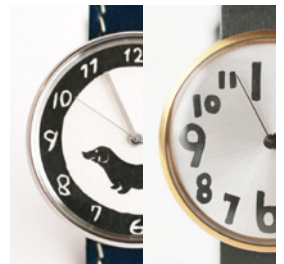
色付き数字 イラスト入りの文字盤 ハンコ文字盤 + 1,000 円