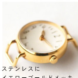
ステンレスに イエローゴールドメッキ 16,000 円