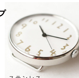
ステンレス 17,000 円